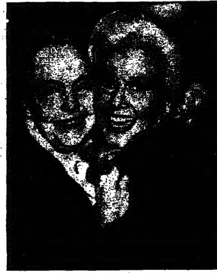
● جدير بوجوه المنيئا الممثلة ابريكيدات تمليل دور الليطولة في المسرحية الراقتة «الاستعراض الذهب» علمبر ارايدو سيني هزل في نيويورك وشارك بوجوه بطولة المسرحية فرقة «اروكيني» ويبدو جدير في الصورة مع صديقها الملكة ليليان فيش بعد نهاية العرض الاول من المسرحية.

لماذا قارتوك بعد ظهورك بمباشرة يحسبني فهدى بالذات ؟ لا اعرف لذلك سببا ممتعا .. هل مجرد مسألة الشكل والشعر الاسمر والعيون الزرق ربما تكن لي كل حال ..